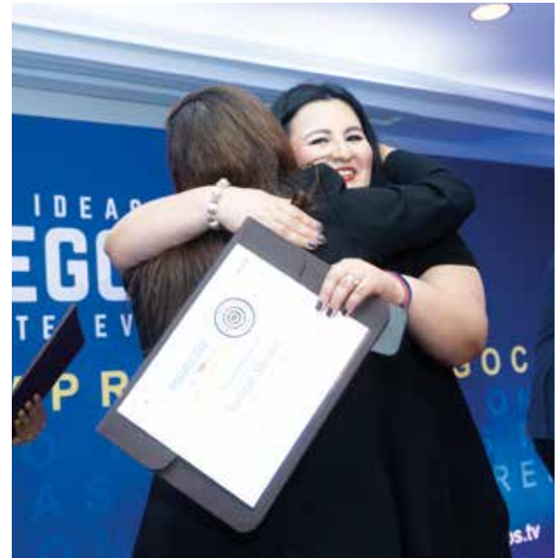
LIDERAZGO CON PROPÓSITO , primer panel del foro que abrió el diálogo sobre la importancia de innovar e investigar.