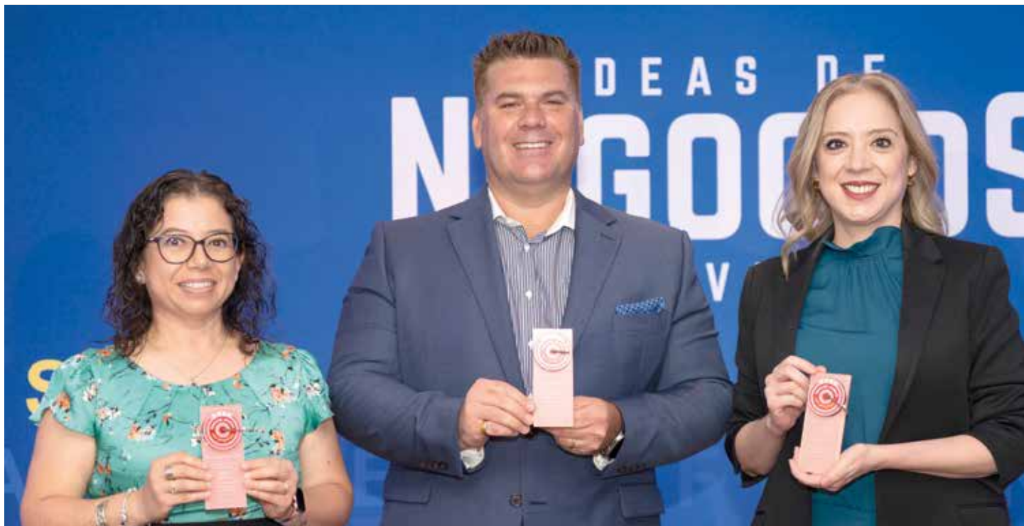
LOS PANELISTAS expusieron los objetivos y logros que mantienen y evolucionan como empresas comprometidas.