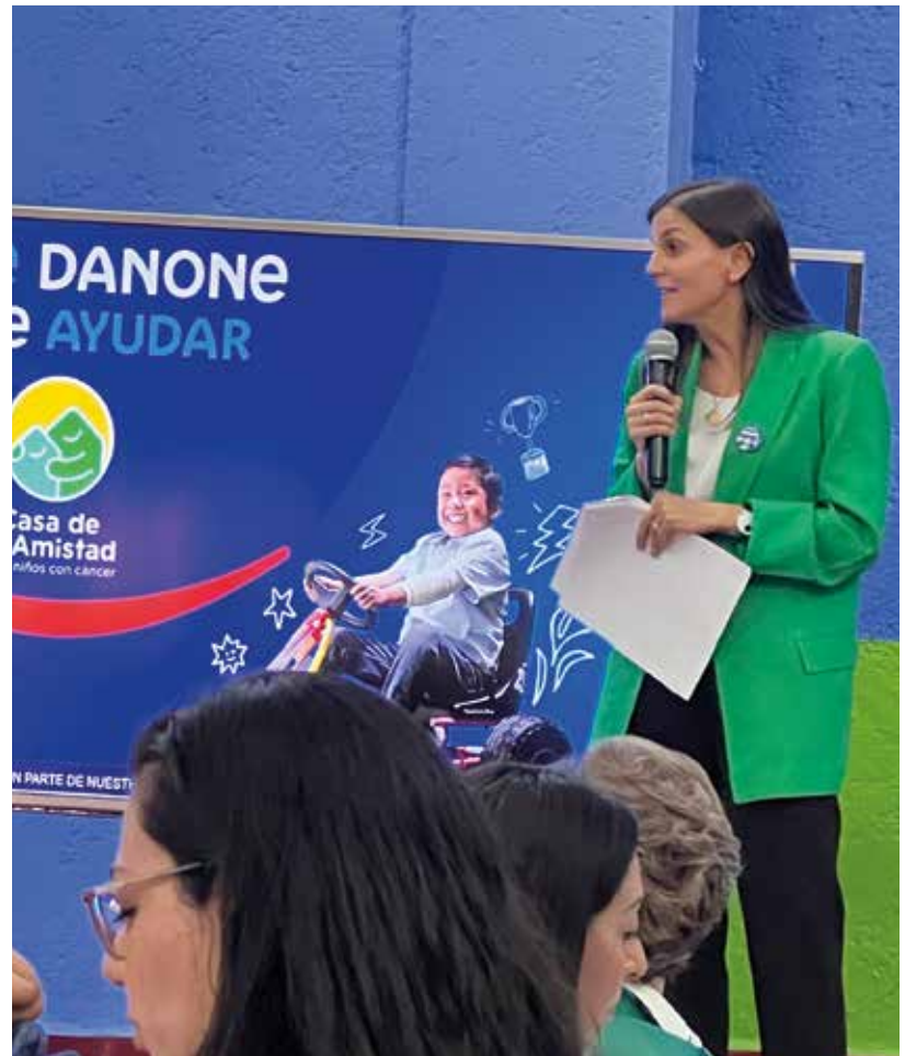
Las inyecciones de capital de Danone suman más de 220 mdp.

Con sus cerca de 47 habitaciones, la fundación recibe a niños de distintos estados, que