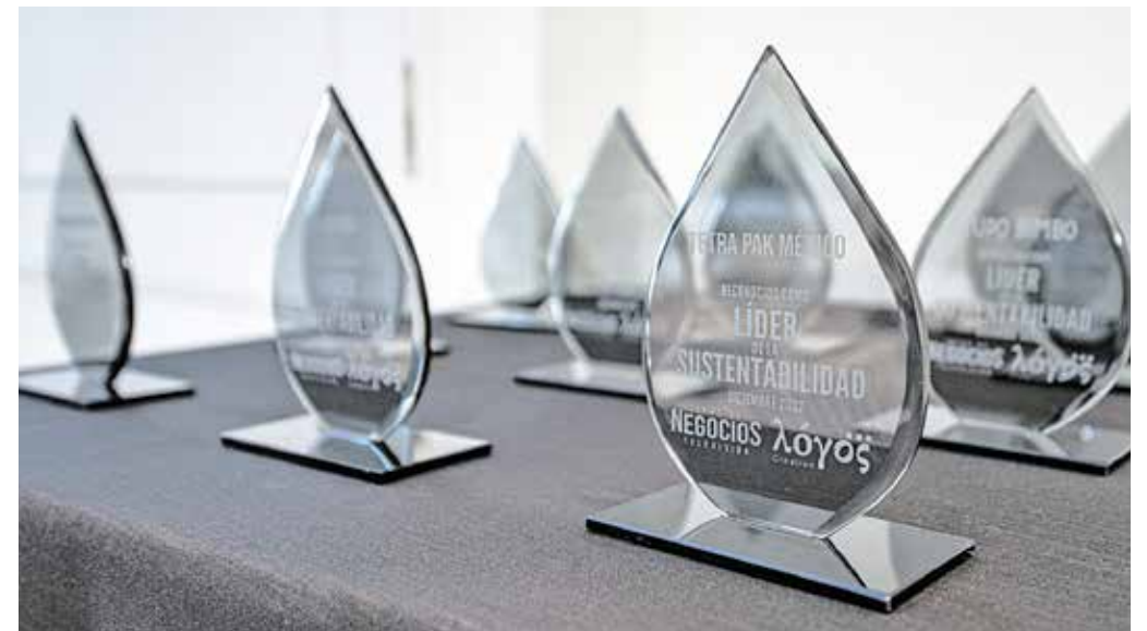
Galardones para los "Líderes de la Sustentabilidad" en México.

TONELADAS DE ENVASES y empaques, Ecoce asociación civil ha logrado recuperar en 20 años