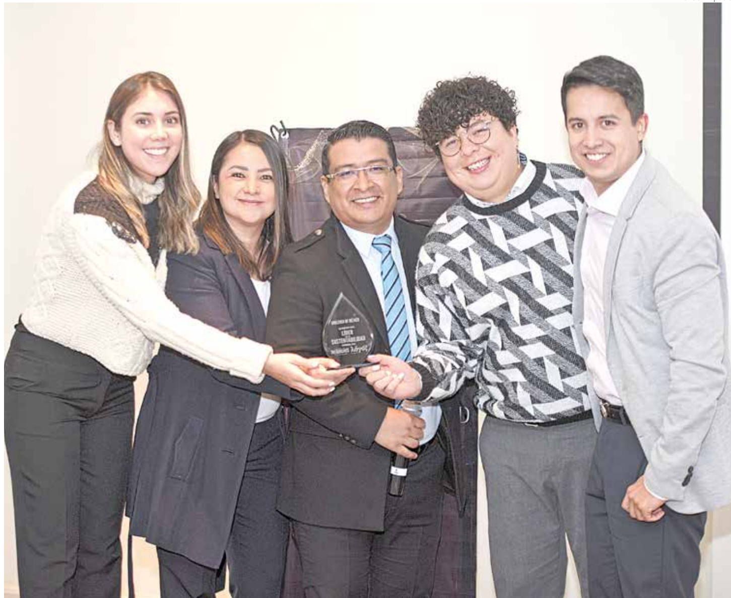
Empresas buscan impulsar acciones por un mundo más sustentable.